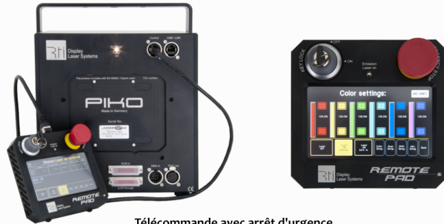
Télécommande avec arrêt d'urgence